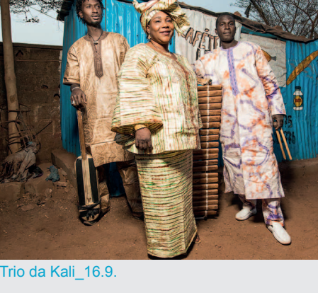
Trio da Kali_16.9.