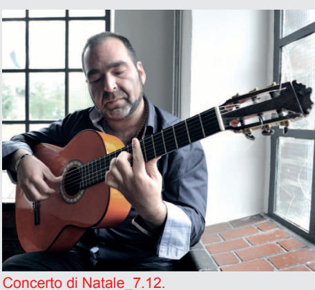
Concerto di Natale_7.12.